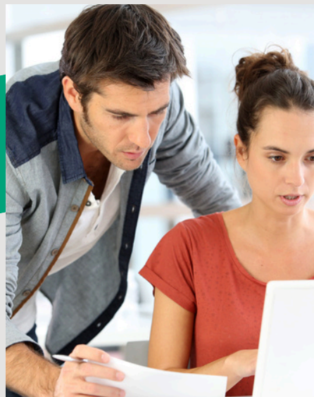
BTS MANAGEMENT COMMERCIAL OPÉRATIONNEL En apprentissage