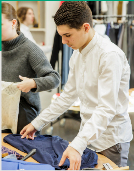
BAC PROFESSIONNEL MÉTIERS DU COMMERCE ET DE LA VENTE Possible en apprentissage