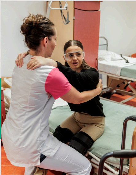
BAC PROFESSIONNEL ACCOMPAGNEMENT SOINS ET SERVICES À LA PERSONNE