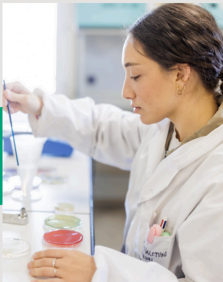
BTS BIOLOGIE MÉDICALE En apprentissage