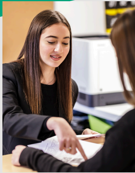
BAC PROFESSIONNEL MÉTIERS DE L'ACCUEIL