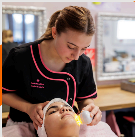
BAC PROFESSIONNEL ESTHÉTIQUE COSMÉTIQUE PARFUMERIE Possible en apprentissage