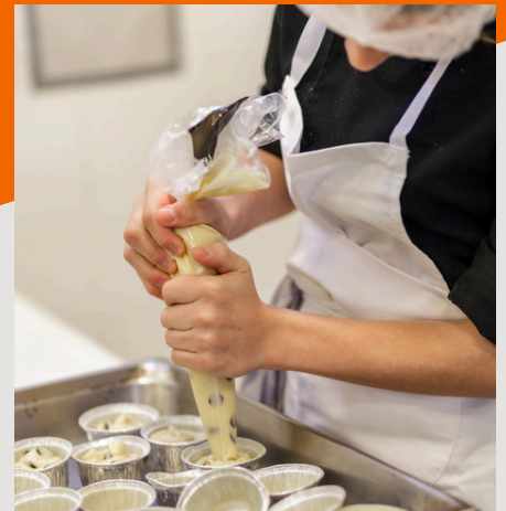
CAP PRODUCTION ET SERVICE EN RESTAURATION Possible en apprentissage