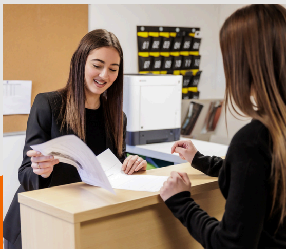
BAC PROFESSIONNEL MÉTIERS DE L'ACCUEIL