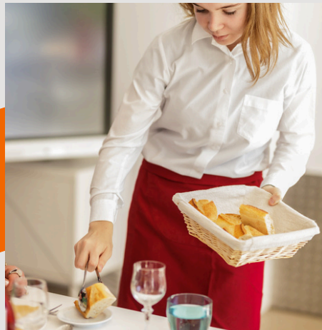
CAP COMMERCIALISATION ET SERVICE HÔTEL CAFÉ RESTAURANT Possible en apprentissage