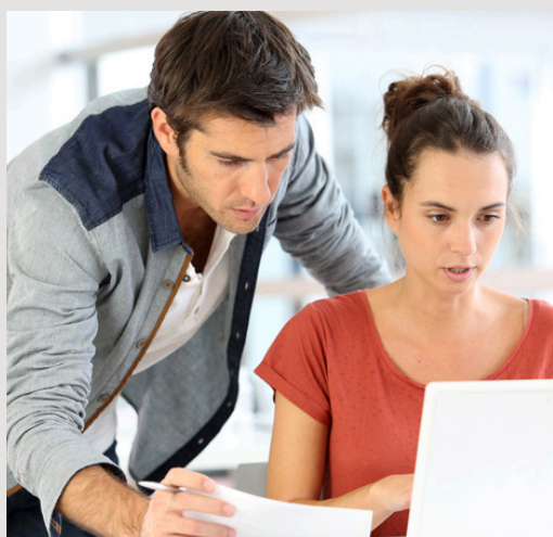
BTS NÉGOCIATION ET DIGITALISATION DE LA RELATION CLIENT En apprentissage