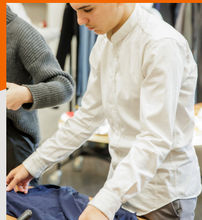
BAC PROFESSIONNEL MÉTIERS DU COMMERCÉ ET DE LA VENTE