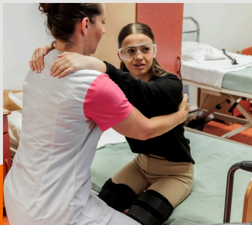
BAC PROFESSIONNEL ACCOMPAGNEMENT SOINS ET SERVICES À LA PERSONNE