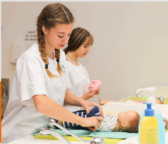
CAP ACCOMPAGNANT EDUCATIF PETITE ENFANCE Possible en apprentissage