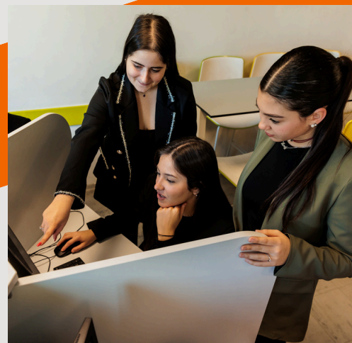
BAC PROFESSIONNEL GESTION ADMINISTRATION