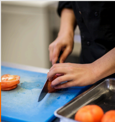
CAP CUISINE Possible en apprentissage